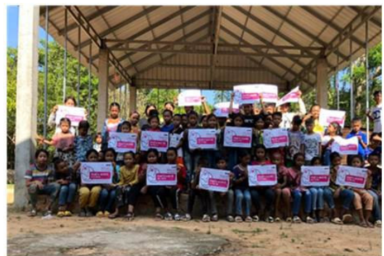
Weltkindergebetstag Kambodscha 2023