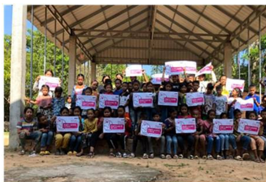
Weltkindergebetstag Kambodscha 2023