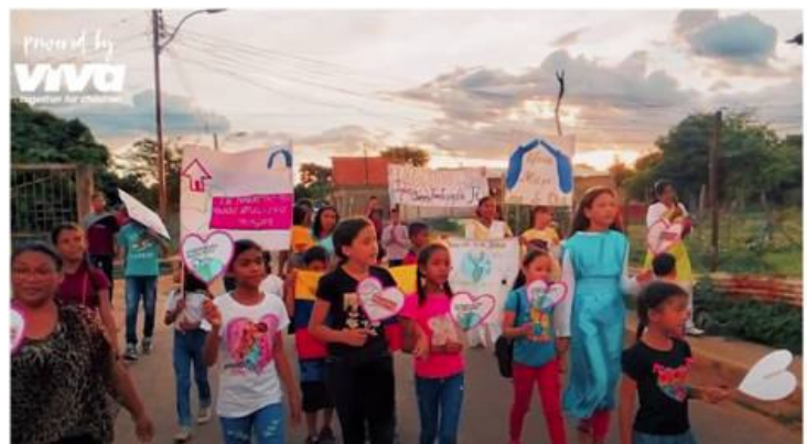
Weltkindergebetstag Lateinamerika 2023

Kinder können auf verschiedene Weise beten: Sie können 3er Gebetszellen bilden, einen Gebetsbaum erstellen, Gebete auf Luftballons schreiben, Gebete auf Post-it-Zettel auf Landkarten schreiben oder Videos mit internationalem Live-Austausch verwenden.